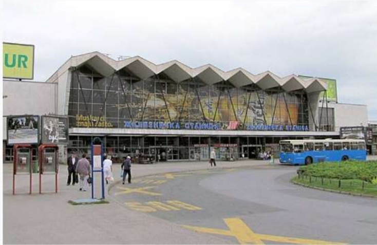
Glavni ulaz u stanicu